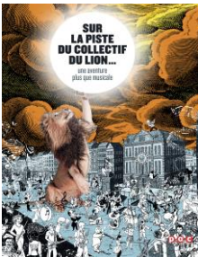
Illustration : © Racasse-Studio

14h00-14h50 : Débat : « Art et Politique Culturelle. Quelle implication pour les artistes dans l'élaboration d'une politique culturelle ? » par le Collectif du Lion.